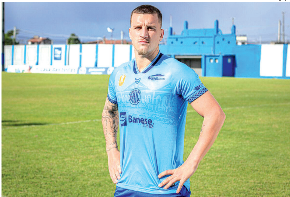
O novo manto tem características com alusão aos 75 anos do departamento de futebol

Nos punhos, é aplicado um padrão de losangos que simula uma escama de Dra-