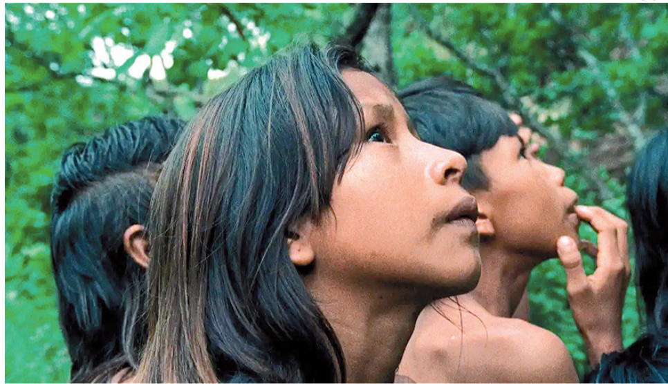
História de comunidade indígena premiada em Cannes chega aos cinemas

“Você tem um cinema como Debussy, cheio de gente, e aí no palco você tem membros de uma comunidade indígena do norte do Bra-